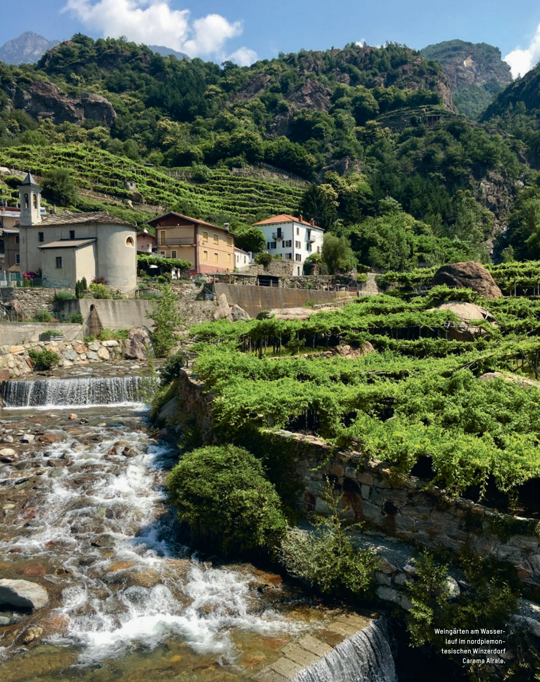
Weingärten am Wasser- lauf im nordpiemon- tesischen Winzerdorf Carema Airale.